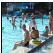
Koupaliště a bazény