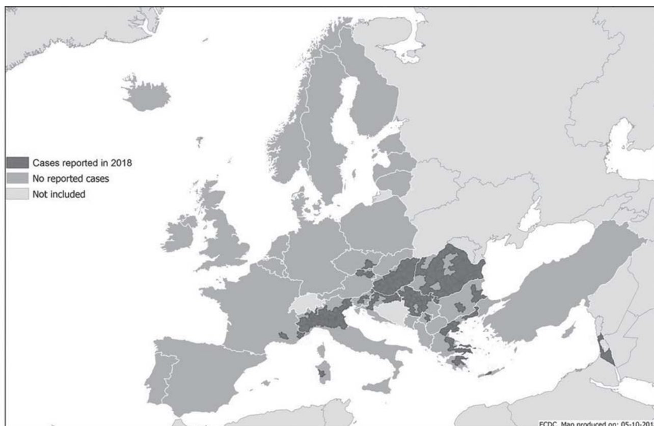
Obrázek 1: ONEMOCNĚNÍ ZÁPADONILSKOU HOREČKOU u lidí v členských zemích EU/EEA a v zemích sousedících s EU podle postižených oblastí v sezóně 2018, aktualizováno ke dni 4. 10. 2018.

V současné sezóně (k 5. 10. 2018) bylo v evropských zemích evidováno 222 výskytů u koní v evropských zemích, onemocnění jsou hlášena z Itálie 120 případů, Maďarska 79, Řecka 13, Francie 5, Rumunska 2, Rakouska 1, Maďarska 1 a Slovinska 1 [3].