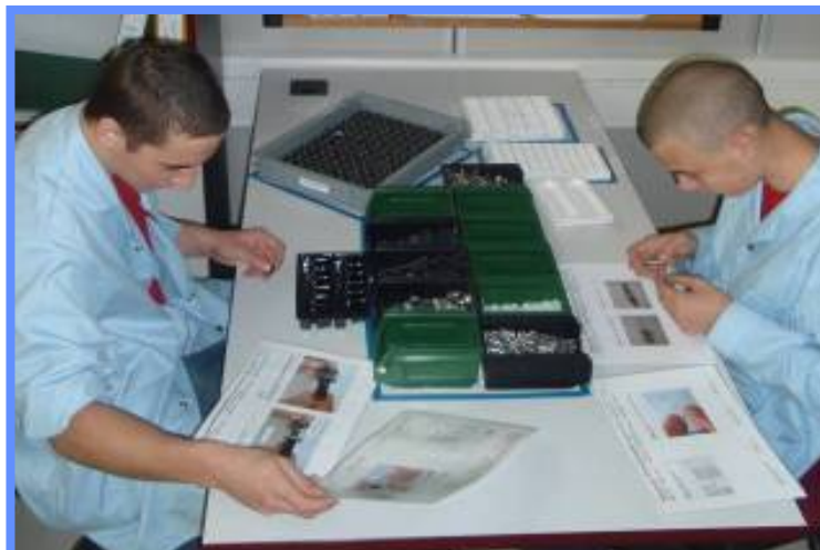
Jednoduchá montáž výrobků Honeywell