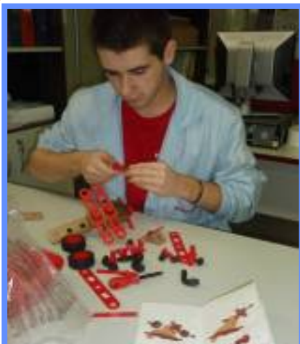
Montáž IKEA hračka